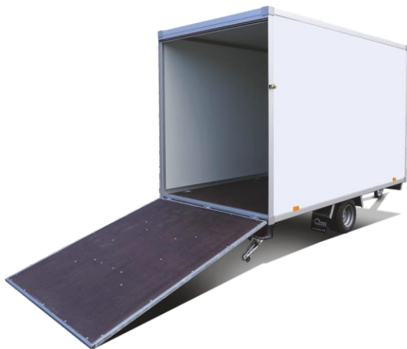
Auffahrklappe – leichte Handhabung, durch Gasdruckdämpfer unterstützt