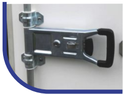
Doppelflügeltür hinten mit Drehstangenverschluss